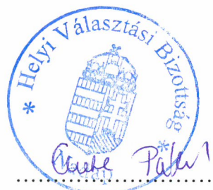
Antal Pálné Helyi Választási Bizottság Elnöke